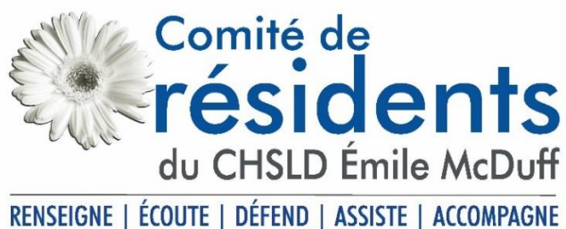
Image du comité

Créé le 25 septembre 2015, le comité des résidents est affilié à la Fédération des comités des usagers et des résidents du Québec (FCURQ), au Regroupement provincial des comités des usagers (RPCU), à Couleur de la vie, à l'Amitié n'a pas d'âge, à L'appui Lanaudière.