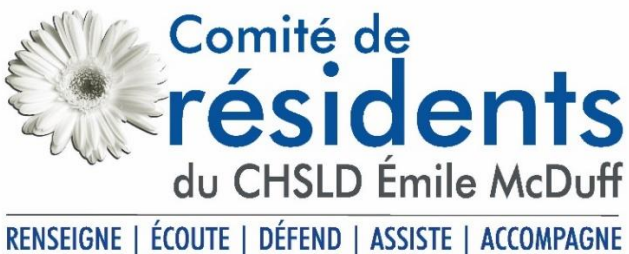
Image du comité

Créé le 25 septembre 2015, le comité de résidents est affilié à la Fédération des comités des usagers et des résidents du Québec (FCURQ), au Regroupement provincial des comités des usagers (RPCU), à Couleur de la vie, à l'Amitié n'a pas d'âge, à L'appui Lanaudière.