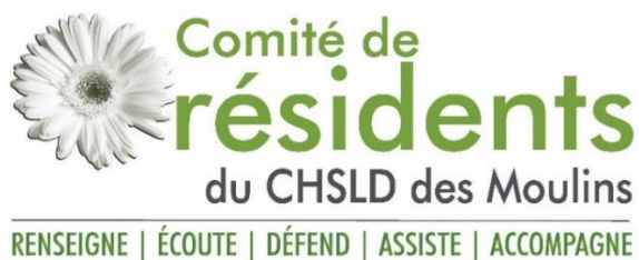
Image du comité

Créé le 24 septembre 2014, le comité de résidents est affilié à la Fédération des comités des usagers et des résidents du Québec (FCURQ), au regroupement provincial des comités des usagers (RPCU), à L'Amitié n'a pas d'âge et la Fédération québécoise du loisir en institution.