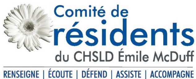
Image du comité

Créé le 25 septembre 2015, le comité des résidents est affilié à la Fédération des comités des usagers et des résidents du Québec (FCURQ), au Regroupement provincial des comités des usagers (RPCU), à Couleur de la vie, à l'Amitié n'a pas d'âge, à L'appui Lanaudière.